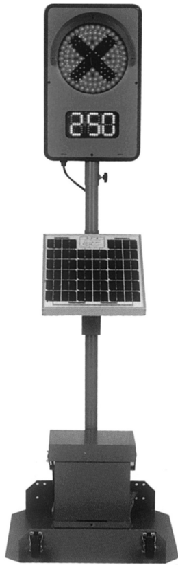
1灯式 CGS-1250S-K 可搬型立脚台仕様